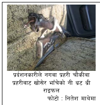
प्रदर्शनकारीले नगवा प्रहरी चौकीवा प्रहरीबाट खोसेर भाँचेको नी थ्रट थ्री राइफल