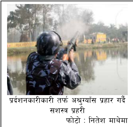
प्रदर्शनकारीकरी तर्फ अश्रुग्याँस प्रहार गर्दै सशस्त्र प्रहरी