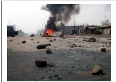
मधेश आन्दोलनको एक झलक