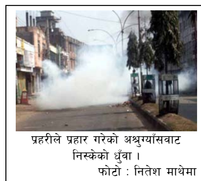
प्रहरीले प्रहार गरेको अश्रुग्याँसवाट निस्केको धुँवा ।