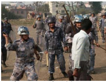
कर्फ्यु उल्लंघन गर्दा प्रहरीले सडकमा हिडेका बटुवालाई पिट्न खोज्दै सशस्त्र प्रहरी ।