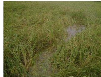
बलात्कार गर्न प्रयास गरिएको स्थान