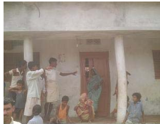
पीडित युवतीको घर तथा आफन्त