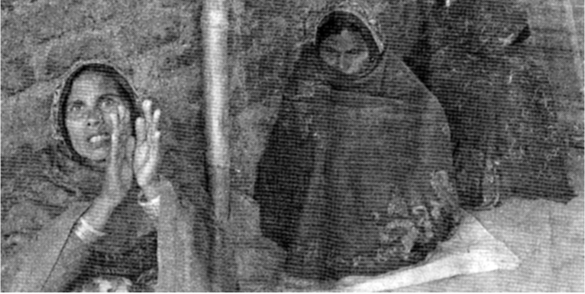
अनुसन्धानका लागि हिरासतमा लिइएका महिलाहरु

यौनाङ्गमा कोचारिदिएको स्वीकार गरेका थिए तर निज भूर्दिदेवीलाई भुण्डाएर मारेको अस्विकार गरेका थिए ।