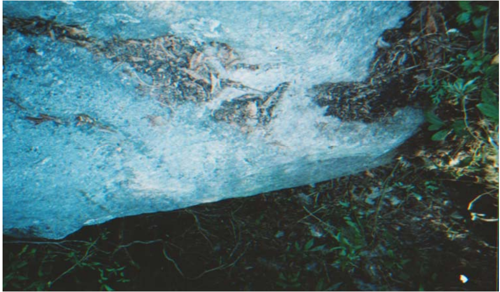
हत्या पछि घिसाई लगी ढुंगा माथिबाट खसाईएको स्थान

हत्या पश्चात् घिसाई १०० मिटर ओरालो तर्फ लगी ओरालोमा रहेको ठूलो ढुङ्गाबाट खसाएर हिँडे ।