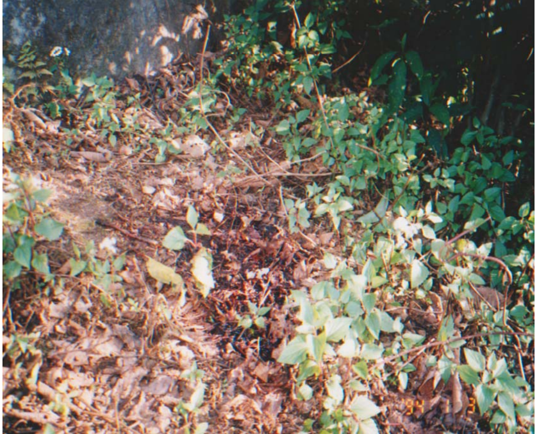
जुकेपानीको जंगलको सानो चौरमा हत्या गरिएको रगताम्य स्थल

अगाडीबाट रेटिएको, एकातर्फको आँखा र खुट्टामा छुरा प्रहार गरी मारिएको अवस्थामा देखेको कुरा एक प्रत्यक्षदर्शीले बताए । हत्यापछि माओवादिहरु उत्तरतर्फ लागेको समेत बताए ।