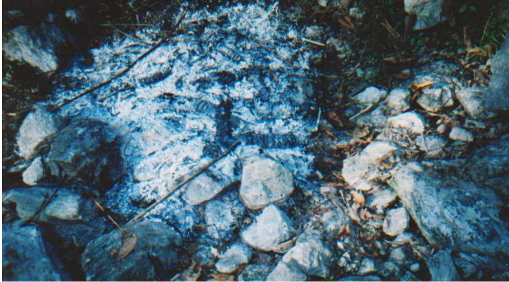
बाँभेको नुनथलामा भएको हत्याको घटनास्थल

जफे गाविस वडा नं. ८ मा भएको हत्याको घटनास्थलका प्रत्यक्षदर्शीका अनुसार मिति २०६१ साल चैत १३ गते बिहान अन्दाजी ११:३० बजेको समयमा पाँच जनाको समूहले तीन जनालाई डोरीले हात पछाडि बाँधिएको अवस्थामा दक्षिणतिरबाट ल्याए । वडा नं. ८ बाँभेको उत्तर-दक्षिणको मूल बाटो नुनथला भन्ने ठाउँमा माओवादीको दुई जनाको समूहले एकजना सैनिकलाई राखे र अरू ३ जनाले दुई जनालाई उत्तरतिरको उकालोबाट गाउँदेखि करिब ४०० मीटर उत्तर-पश्चिममा रहेको ओखरढाँड (बोट) र जुगेपानी जंगलतर्फ लगे । बाँभेको नुनथलामा राखेको सैनिकलाई घाँटीको पछाडिबाट रेटी हत्या गरे । घाँटी छुट्टिन अलिकतिमात्र बाँकी थियो ।