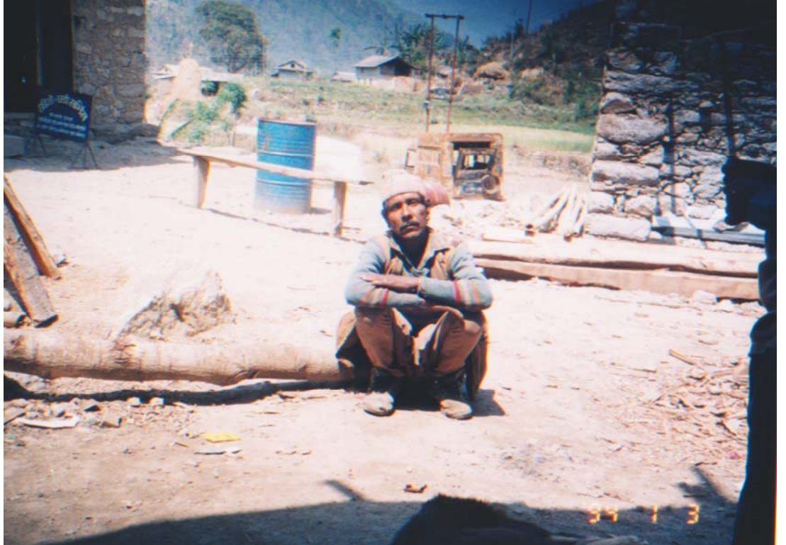
अपहरण गरिएको स्थल

घटनाका प्रत्यक्षदर्शीका अनुसार केहि दिन अघि देखि माओवादीहरुले खसीको निर्यातमा रोक लगाएका थिए । मिति २०६१ साल चैत्र १३ गते खिम्ती देखि काठमाडौं जाँदै गरेको यात्रु बाहक बसको छतमा समेत यात्रुहरु बसेका थिए । दोलखा जिल्लाको जफे गाविस वडा नं. ७ को डुडे प्रतिक्षालयमा बस रोकियो । बस रोकिन लागेको अवस्थामा पूर्वतिरबाट बस रोक् भन्ने आवाज आयो । बसको छतमा खसी राखिएको थियो । बसमा भएका खसी भार्नलाई माओवादीले गाडी रोकेका थिए ।