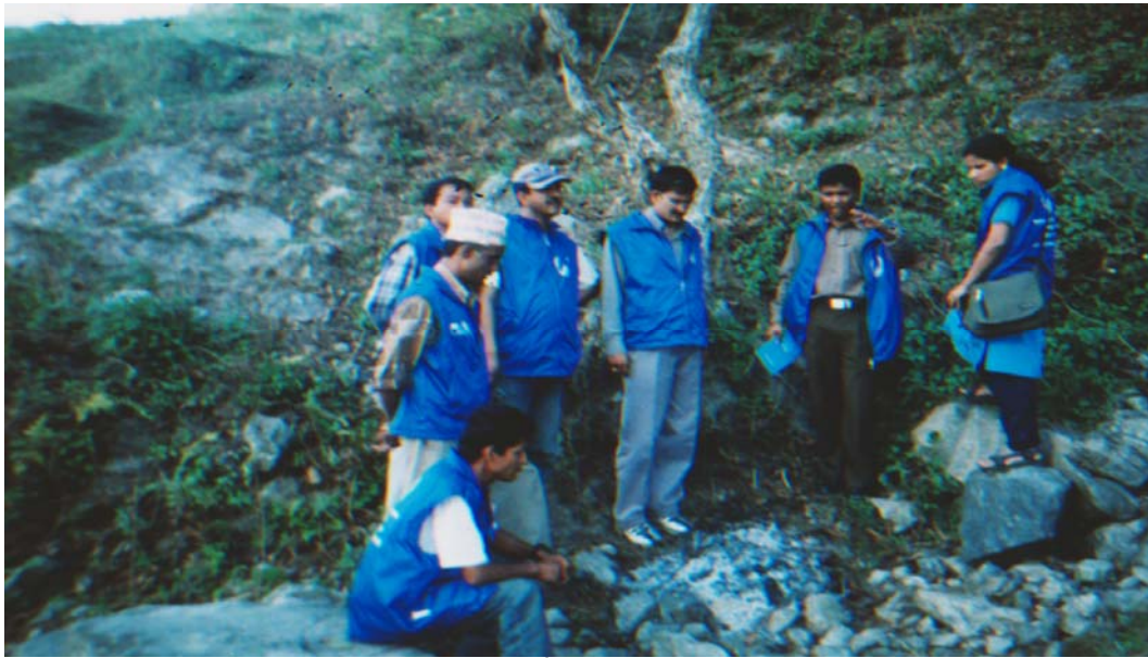
बाँधेको नुनथलाको घटनास्थल अवलोकन गर्दै अध्ययन टोली

उक्त रगताम्य रहेको ठाउँमा पछि सैनिकहरु आई बाबियो (वनकस) को लठारो जलाइएको प्रत्येक्षदर्शीले बताए । उत्तर छेउमा रगत सुकेको अवस्थामा थियो ।