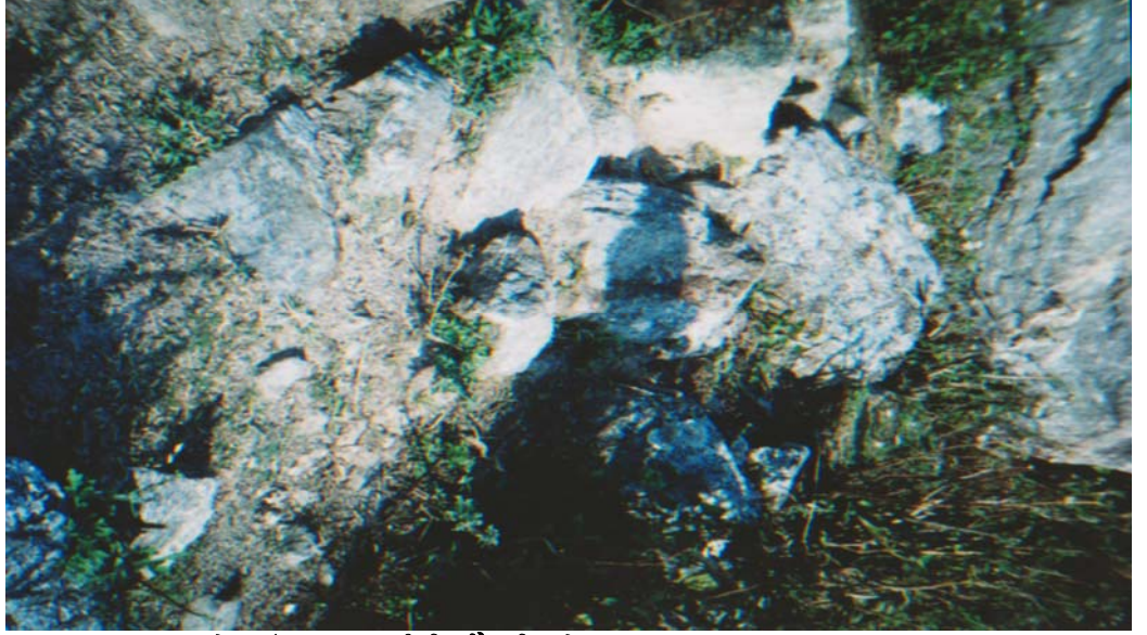
ओखरढाँडमा हत्या गरी घिसाई लगाएको स्थान

मध्ये १ जनाले छुराले छातीमा प्रहार गर्‍यो । छुरा प्रहार गर्दा रगतको छिर्का आयो । उक्त छुरा प्रहार गरिएको ठाउबाट बटारेर मासुको चोक्टा निकालियो । त्यसपछि दुवै जना माओवादीले ठूलो ढुङ्गामाथी चढी करिब २ देखि ५ किलो तौल भएका ४ वटा ढुङ्गाले टाउकोमा प्रहार गरी हत्या गरे ।