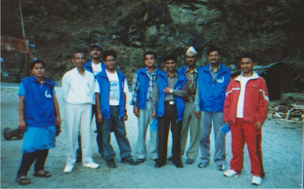
घटना अध्ययन टोली