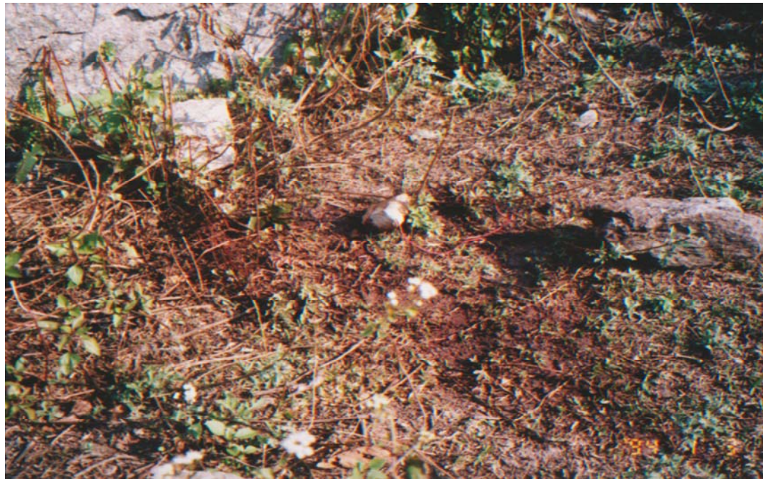
ओखरढाँडमा गरिएको हत्याको घटनास्थल

ओखरढाँडमा भएको घटना स्थलको अवलोकन गर्दा ठूलो ढुङ्गाको फेदमा रगताम्य रहेको पाईयो । घटनास्थलमा रातो र कालो बाटिएको मसिनो विजुलीको तार काटिएको अवस्थामा दुई ठाउँमा रहेको र रातो मसिनो प्लाष्टिकको डोरी रगताम्य भएको ठाउँदेखि ५ मिटर तल