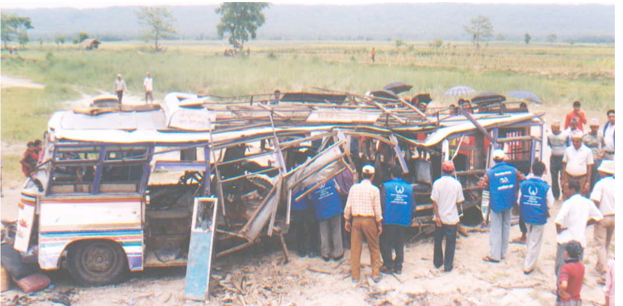
क्षतिग्रस्त बसको निरीक्षण गर्दै अनुगमन टोली

घटनास्थल अवलोकन गर्दा बसको अगाडि र पछाडि भाग, बीचको भागको तुलनामा कम क्षतिग्रस्त थिए। गाडीको एकसल भाँचिएको र बाहिर निस्किएको थियो। अगाडिको टायरमा क्षति पुगेको थिएन। पछाडिको दायाँ तिरको टायर एक मिटर अगाडि उछिट्टिएको थियो। पछाडीको टायरसँगै विस्फोट भएको ठाँउमा उत्तर-दक्षिण १२ फिट, पूर्व-पश्चिम १२.६ फिट लम्बाइको खाडलमा जमिन मुनिबाट पानी जमेको देखियो। खाडलको पानीसम्म दुई फिट र पानी मुनी २.५ फिट गरी जम्मा ४.५ फिट गहिरो खाडल परेको पाइयो। विस्फोटनका कारण बसबाट टुक्रिएका फलामका पाताहरू करिब १ सय मिटर परसम्म पुगेका थिए। यात्रुले आफूसँगै ल्याएका आलु, मकै, केरा, गुन्डीहरू यत्रतत्र अवस्थामा थिए। जुत्ता, चप्पल, कपडा घटनास्थल वरपर छरिएका थिए। विस्फोटनबाट क्षतविक्षत भएका शरीरका साना साना मांशपेशीका टुक्राहरू बस मुनी र वरिपरी देखियो। बसको बीचको भाग पूर्णरूपमा क्षतिग्रस्त देखियो। सिटहरू भाँचिएका र केही जलेको अवस्थामा थिए। क्षतिग्रस्त बसको करिब तीन मिटर दक्षिण तिर ९-१० वर्षको बच्चाको क्षतविक्षत अवस्थामा रहेको एउटा हात र खुट्टा तथा भुँडी करिब दुई फिट बालुवामा पुरिएको अवस्थामा रहेको थियो।