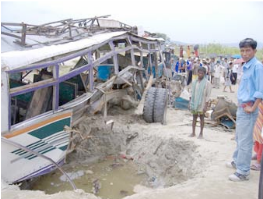
विद्युतीय धराप विस्फोटले बनाएको खाल्डो

घटना बारे वसन्तपुर आएर एम्बुलेन्सलाई फोन गर्थौं। सिनर्जी र कालिका दुईवटा एफ.एम. लाई पनि फोन गरियो। त्यसै बेला कसरा ब्यारेकको फोन त्यहाँ आयो। फोन रिसिभ गर्दा उनीहरूले 'हाम्रो मान्छे परेको छ कि छैन ?' भनी सोधे। मैले 'तपाईंको मान्छे परेको थाहा छैन' भनेपछि पुनः 'हतियार लुटिएको छ कि छैन ?' भनी सोध्दा 'थाहा छैन, ३०-३५ जना मान्छे मरे होलान्, लासहरू छरपस्ट अवस्था छन्, तपाईंहरू तुरुन्त आइपुग्नुस्' भनें। हामी पुनः घटनास्थलतिर गयौं। त्यहाँका चौधरी समुदायका मान्छेलाई गाडा लिएर घाइतेहरूलाई स्थानीय हेल्थ पोष्टमा उपचारको लागि लैजान भन्यौं। घाइतेहरूलाई गाडा तथा ट्रयाक्टरमा राखी उपचारका लागि पठायौं।