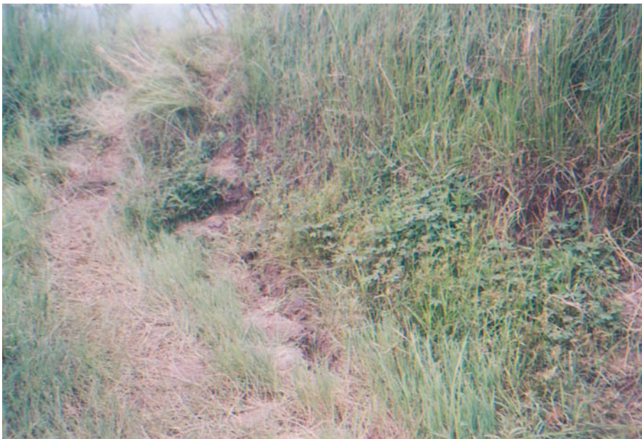
विद्युतीय धराप विस्फोटनको लागि बिच्छ्याइएको तारको लागि खनिएको स्थान

पाँच-छ महिना अघिको कुरा हो, बस व्यवसायी र आर्मीबीचको द्वन्द्वले गर्दा माडीका बसहरू बन्द भएका थिए। आर्मीहरू बिहानको पहिलो गाडीमा आउने र कहिले वसन्तपुर त कहिले कल्याणपुर भर्ने, अनि सर्च गरी साँझ बसमै फर्कने गर्दथे। यसै क्रममा माओवादीले सार्वजनिक गाडीमा आर्मीहरूलाई चढाए त्यस्ता गाडी चलाउन दिँदैनौं भनी