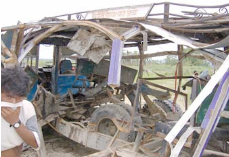
बसको क्षतिग्रस्त मध्य भाग