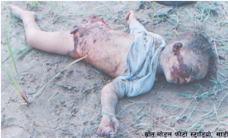
विस्फोटमा मारिएका एक बालकको क्षतविक्षत लास

२३ गते बिहान करिब ७:४५ वा ८ बजेको थियो होला। बसले घटनास्थल नजिकैको कटेरो काटने बित्तिकै दुई जना युवक बेस्सरी खितिखिति हाँस थाले। किन हाँसेको भन्दा उत्तर दिएनन्। बाटोमा मान्छे भरिभराउ भएको बस कुदिरहेको देखेँ। एकैछिनमा ड्याङ्ग आवाज आएको सुने। टायर पड्केछ भन्ने लाग्यो। त्यता हेर्दा कपडा उडेको जस्तो