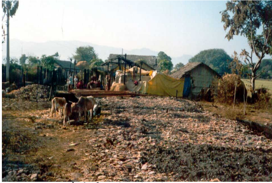
चार चौधरी परिवारको घरको अवशेष