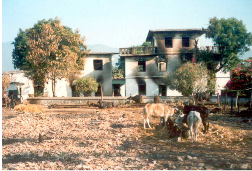
पीडित भूषालको घरको अग्रभाग