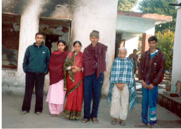
पीडित भूपाल परिवार

tLg j6f aRrf s;/L k9fpg], ;a} gi6 eof]. a:g] 7fpF / vfg] s'/f s]xL klg 5}g. aRrf :s"n hfg] jftfj/0f ldnfO{ lbg' xf]nf.